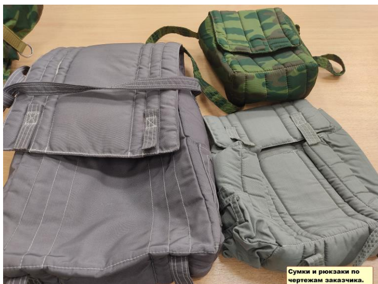
Сумки и рюкзаки по чертежам заказчика.